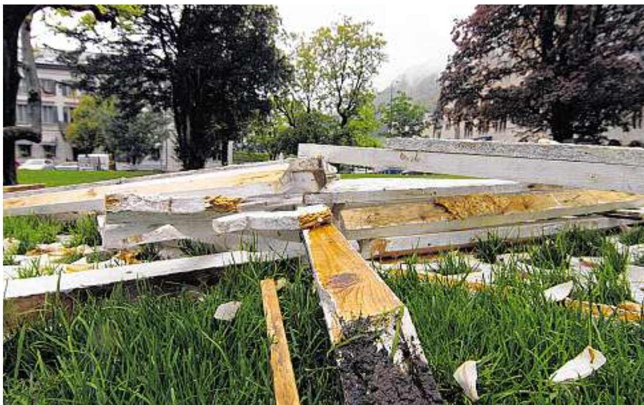
Nur noch Splitter: Seit dem Wochenende liegt das stolze Werk verstreut am Boden.